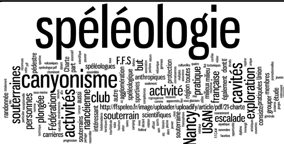
Nuage de mots réalisé à partir du préambule et de la présentation