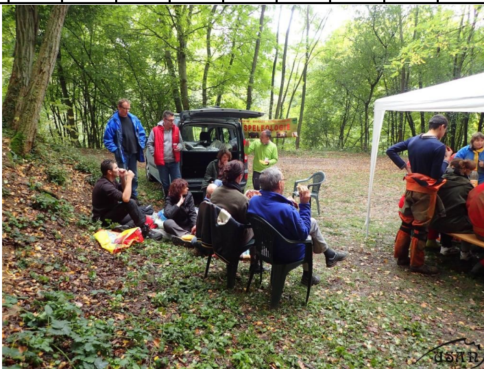
(Suite page 2)

Cette année nous avons innové en proposant, en plus des deux circuits traditionnels d'initiation (traversée de la grotte des Sept-Salles et le fameux « grand huit » dans la grotte des Puits avec la traditionnelle remontée à l'échelle ou la possibilité, pour les plus téméraires, de remonter avec des longes sur une vire remontante, un peu comme une via ferrata), la découverte de la grotte Sainte-Reine dans un parcours réduit : entrée par