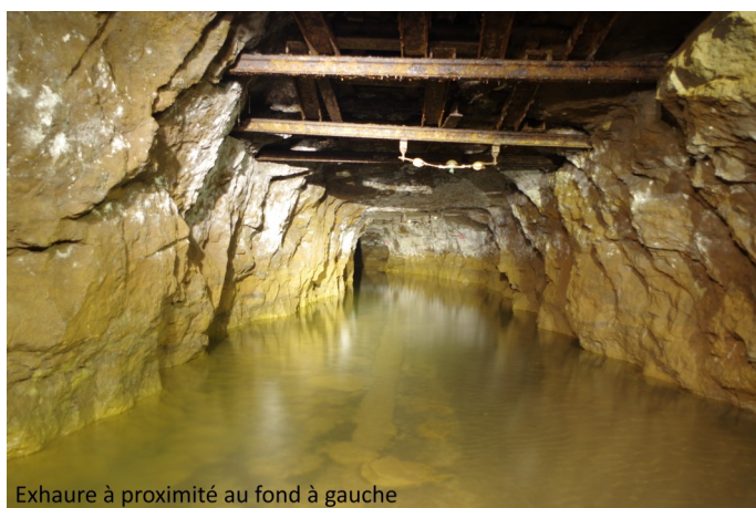
Exhaure à proximité au fond à gauche