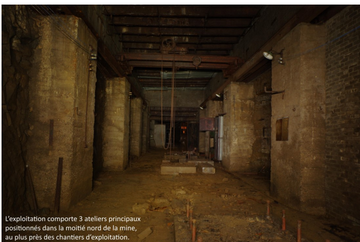
L'exploitation comporte 3 ateliers principaux positionnés dans la moitié nord de la mine, au plus près des chantiers d'exploitation.