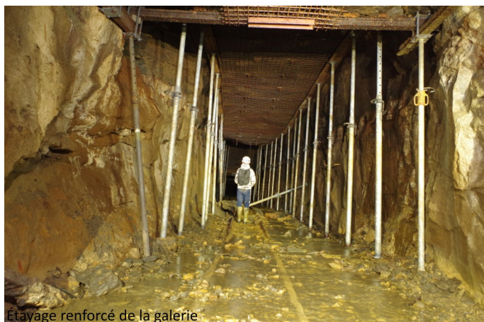
Étayage renforcé de la galerie

Les poutrelles de maintien du toit de la galerie ont été renforcées en deux endroits par des étais latéraux très rapprochés, travaux effectués pour garantir la pérennité du captage. À contrario, cette consolidation montre aussi la fragilité du lieu. D'ailleurs, certains étais ont été depuis renversés par la chute de blocs.