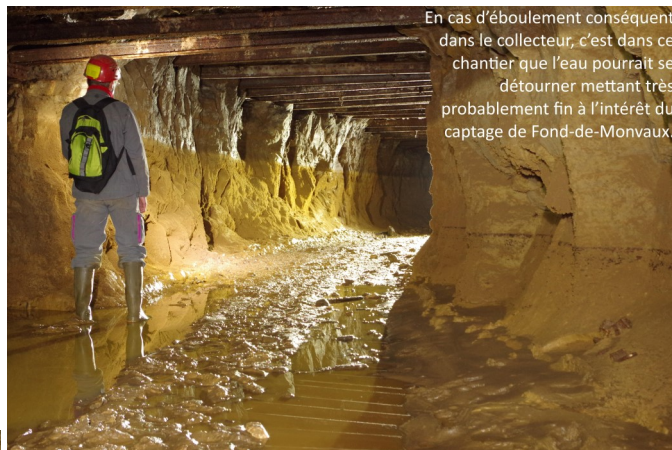
En cas d'éboulement conséquent dans le collecteur, c'est dans ce chantier que l'eau pourrait se détourner mettant très probablement fin à l'intérêt du captage de Fond-de-Monvaux.

Nous arrivons enfin à proximité de la sortie. Aucun de nous ne souhaitant se mouiller les pieds, nous stoppons notre avancée.