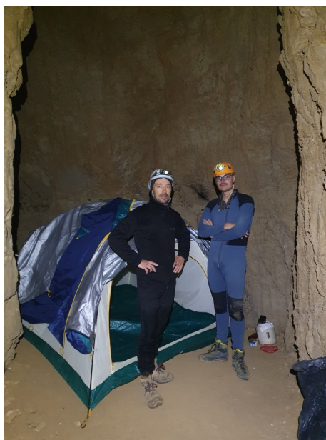
(Suite page 2)

On fait une mini pause en bas du puits du Guano et ensuite ça