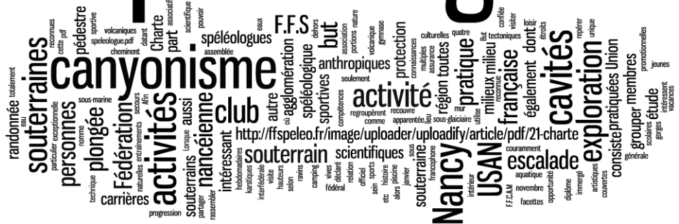
Nuage de mots réalisé à partir du préambule et de la présentation