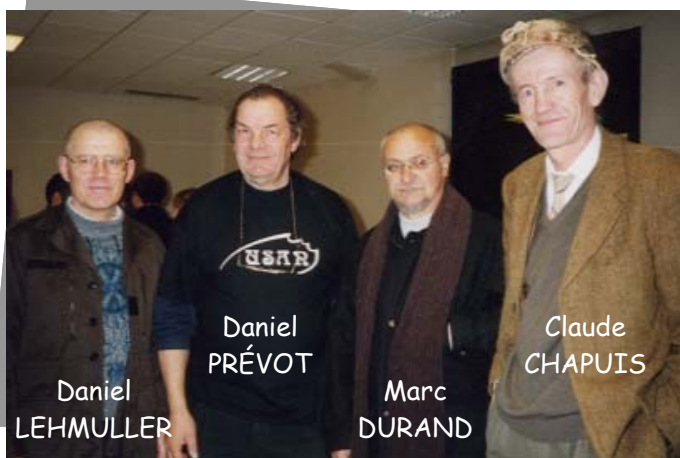
Quelques Usanosaires (fondateurs de l'USAN)